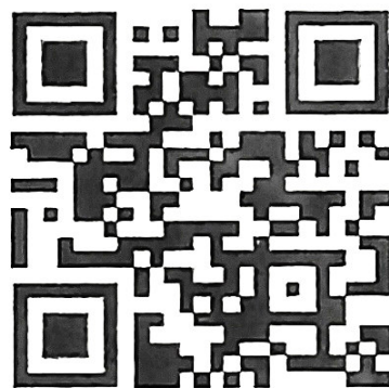
QR-код Сообщества в ВК

Сообщество в Одноклассниках: https://ok.ru/group/70000001058727